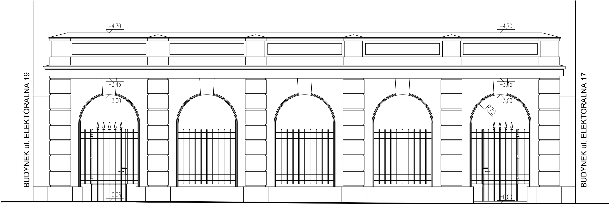
ELEWACJA POŁUDNIOWA (od dziedźńca) skala 1:50